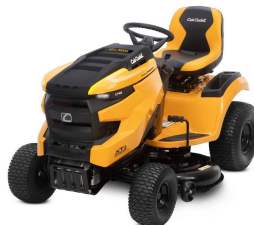
Cub Cadet® XT1 LT42