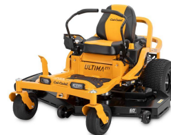
Ultima Series™ ZT1 60