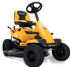
Cub Cadet® CC30H